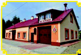
Przebudowany budynek wielofunkcyjny w Bukowcu.