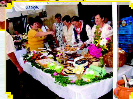
Jagodowe specjalia - impreza w Dzikowcu współfinansowana z PROW 2007 - 2013