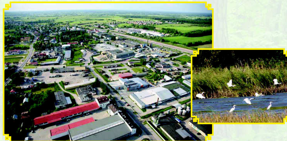
Kolbuszowa z lotu ptaka. Część przemysłowa.