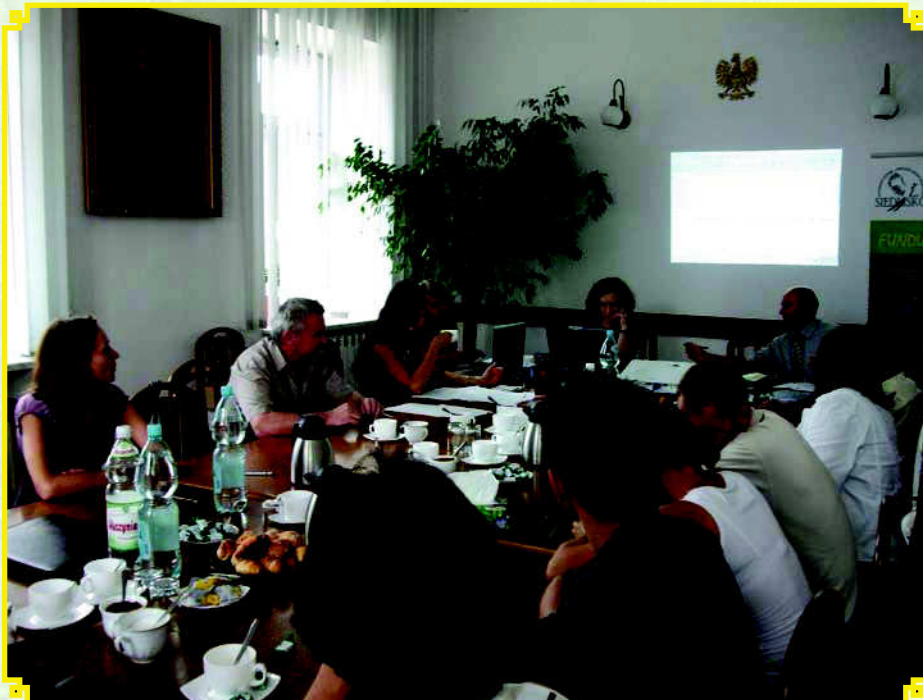
Rada Stowarzyszenia ocenia złożone wnioski pod względem zgodności z Lokalną Strategią Rozwoju

Leader został włączony do Europejskiego Funduszu Rolnego na rzecz Rozwoju Obszarów Wiejskich. W Polsce jest częścią Programu Rozwoju Obszarów Wiejskich na lata 2007–2013 jako oś IV tego programu. Leader jest podejściem przekrojowym, które ma przyczynić się do budowania kapitału społecznego, aktywizacji społeczności wiejskich, poprzez włączenie partnerów społecznych i gospodarczych do wdrażania lokalnych inicjatyw. W ramach Leadera funkcjonują lokalne grupy działania, które wybierają projekty do finansowania. Ich realizacja przyczyni się do osiągnięcia celów zapisanych w lokalnych strategiach rozwoju.