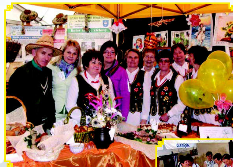
KGW z Majdanu Królewskiego na targach lokalnych grup działania w Rzeszowie

Pomoc jest przyznawana w formie refundacji, w wysokości do 80 % kosztów kwalifikowalnych projektu. Maksymalna wysokość pomocy na realizację projektów w jednej miejscowości wynosi 500 000 zł w okresie realizacji Programu Rozwoju Obszarów Wiejskich na lata 2007 -2013. Wielkość pomocy przyznanej na realizację jednego projektu nie może być niższa niż 25 000 zł.